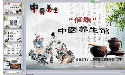
图 14 卢贝参赛作品 PPT 截图