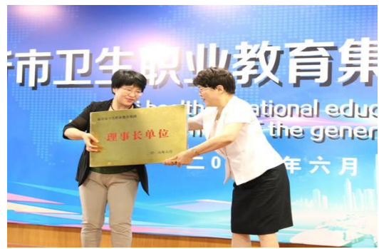
图 13 卫生职教集团成立