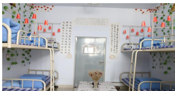
图 1 宿舍装扮类作品

“我寝我秀”活动。主要是学生们通过各种方式向大家展示自己的宿舍文化。在本次公寓文化节中学生们或积极装扮自身宿舍，然后拍摄、制作成原创宿舍生活图片，或以寝室生活为题材制作手抄报，或将真实宿舍生活录制、浓缩成小视频。活动丰富了学生的寝室文化生活，增强了彼此之间的交流与沟通，培养了良好的集体主义感，加强了和谐寝室文化建设，营造了良好的学习生活氛围，提高了学生创新能力。