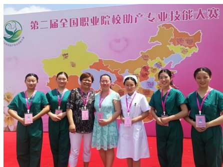
图 1 全国助产专业技能大赛

2. 加强学生专业技能训练，养成良好的职业素养。我校积极参加、承办各校外内项职业技能大赛，在各项各级技能大赛中屡获佳绩，达到了以赛促练、以赛促学的教学效果。