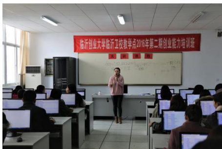
图 5 2016 年创业培训实训课程