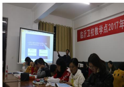
图 4 2017 年创业培训理论课程