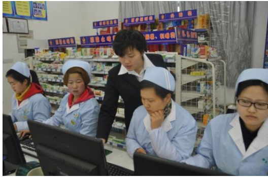
图 12 实习学生培训