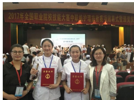
图 2 全国护理专业技能大赛