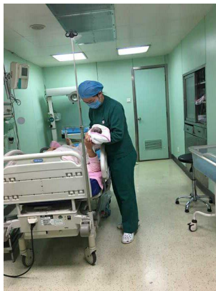
图 10 实习生风采