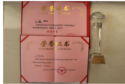
图 10 获奖证书