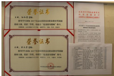
图 13 获奖文件及证书

卢贝的两份作品在所有作品中脱颖而出，由学校推荐参赛，并最终获得全省三等奖的好成绩。