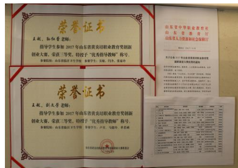
图 9 创业比赛获奖证书