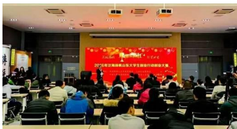
图 11 大赛启动仪式

2016年8月山东省泛海扬帆大学生创业行动创业大赛正式启动，由我科室进行指导和推荐的、我校2013年第一期创业能力培训班学员陈祥枚创办的山东阿凡提教育发展有限公司，在山东省泛海扬帆大学生创业行动创业大赛的100家单位中脱颖而出，荣获第五名，斩获二等奖，成为前十名中唯一一家教育行业企业，为临沂市大学生创业争得荣誉。