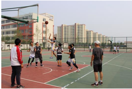
图 9：三人制篮球赛淘汰赛阶段