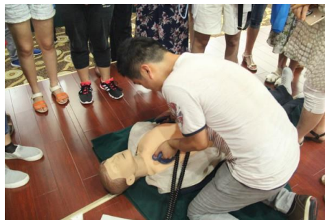
图 14 120 岗前急救培训授课现场