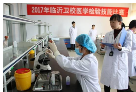
图 6 学校检验技能比赛

3. 通过就业主题班会、就业知识讲座、小型招聘专场、校内模拟招聘大赛等活动有效锻炼学生的学习能力、岗位适应能力和岗位迁移能力。