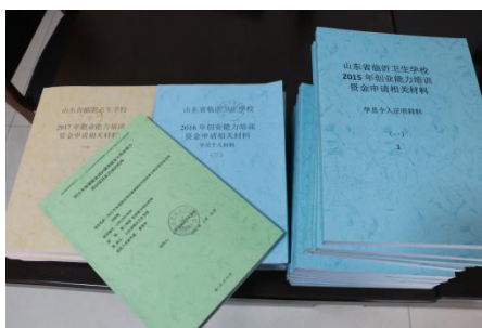
图 1 投标文件及历申请培训相关材料

根据上级主管部门要求，我校在创业培训方面一直严格遵守各项培训章程，并真做好从开班、培训、结业、申请资金各方面工作，并将校内职业规划课程与创业培训有效结合，理论课程与实训课程相结合，制定符合我校学生专业特点的教学大纲及教学计划。