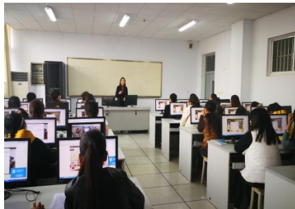
图 6 2017 年创业培训实训课程