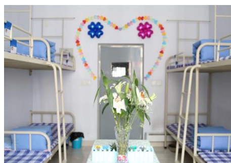
图 2 宿舍装扮类作品