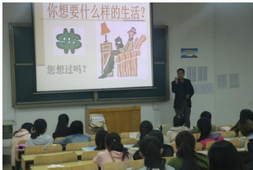
图 8 创业培训

4. 在创新创业能力方面，学校继续大力开展创业能力培训，共培训学员 5 期，6 个班次、214 人次，全部学员均通过结业考试，获得创业能力培训合格证书。并组织学生参加省级创新创业大赛，增强学生的创业思路和素养。