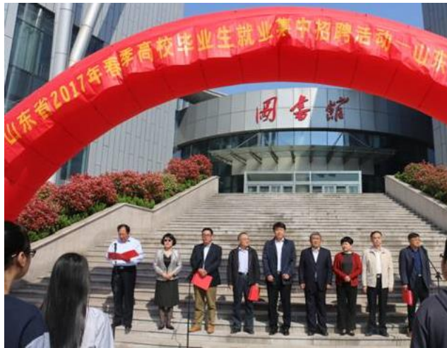
图 7 2017 年招聘会

4. 在创新创业能力方面，学校继续大力开展创业能力培训，共培训学员 5 期，6 个班次、214 人次，全部学员均通过结业考试，获得创业能力培训合格证书。并组织学生参加省级创新创业大赛，增强学生的创业思路和素养。