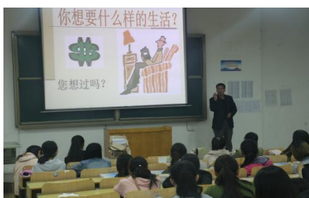
图 3 2016 年创业培训理论课程