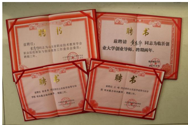
图 15 部分聘书