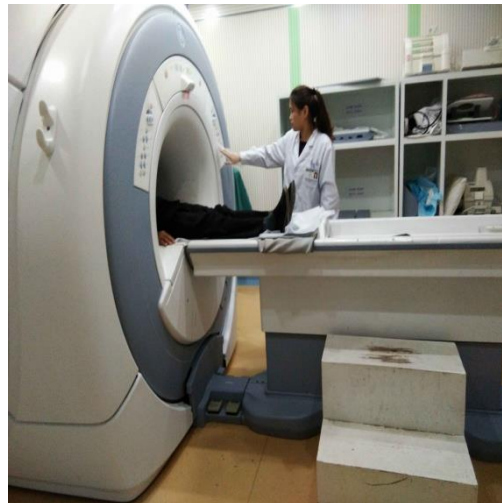
图 11 实习生风采