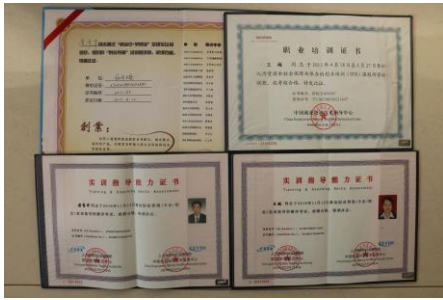
图 7 师资证书