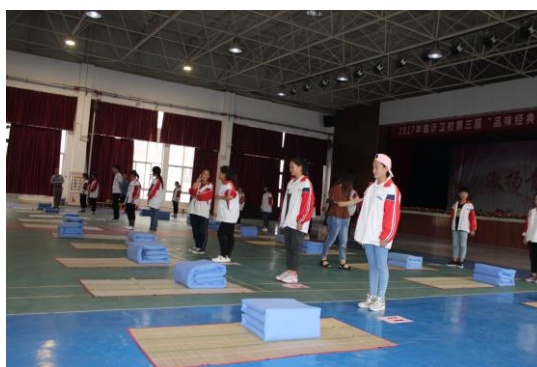
图6: “叠被子比赛”紧张进行中 图8: 成果展示

三人制篮球赛与两人三足运水接力。学生们以宿舍为单位，组成自己的队伍，报名队伍上场比赛时统一服装，并有明显号码标识。三人制篮球赛时，比赛双方3对3在同一半场对抗；比赛中严格遵守比赛规则，秉承“友谊第一，比赛第二”活动宗旨，严禁使用危险或违反体育道德动作，一切判罚服从裁判，避免因比赛产生冲突。这项活动丰富了校园课余文化生活，活跃了校园氛围，增强学生体育锻炼意识和培养积极向上、勇敢拼搏的精神。