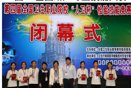
图 3 全国检验专业技能竞赛