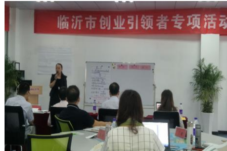
图 8 十分钟授课环节