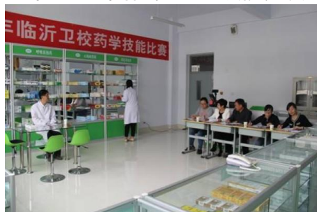
图 5 学校药学技能比赛