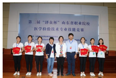
图 4 山东省级检验专业技能竞赛